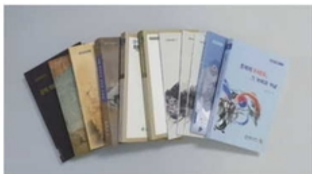
충북학 자료 총서 11권

도민의 교양 수준을 높일 수 있는 충북 관련 정보를 제공하고자 기획된 총서로, 「새야 새야 파랑새야」(2001), 「마음으로 노래한 글 직지」(2006), 「충북인의 기억이 머무는 곳」(2013), 「충북바로알기」(2015) 등을 발간하였다.