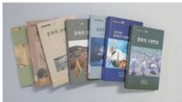
충북학 연구 총서 7권

1999년 창간호를 시작으로 매년 발간하는 충북학연구지이다. 창간호부터 제10집까지는 충북의 정체성을 확립하고 '충북학' 연구 기반 조성을 위한 순수 논문집으로 발간하다가, 2009년 제11집부터는 단순 논문집 형태에서 벗어나 저널지 형태로 발간하고 있다.