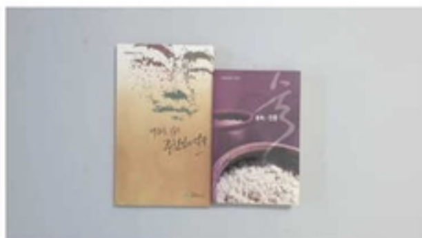
중원문화유산 시리즈 2권

충북과 충북인의 사회·경제상을 담고 있는 『한국 충청북도일반』(1909, 충청북도관찰도)을 번역하여 현재 충청북도 각 시·군별로 나누어 『100년 전 충북의 옛 모습』이라는 제목으로 발간한 도서이다. 2000년부터 충주시편으로 시작으로 10권을 발간하였다.