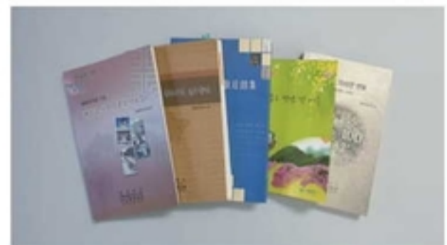
기타 충북학 관련 서적 5권

충북지역의 문화유산을 소개하고자 기획된 도서로, 지금까지의 지식 위주로 문화유산을 바라보는 시선에서 벗어나서 마음과 감성으로 문화유산을 소개하고 있다. 『마음으로 읽는 중원인의 얼굴』(2009), 『충북의 전통술』(2011) 등을 발간하였다.