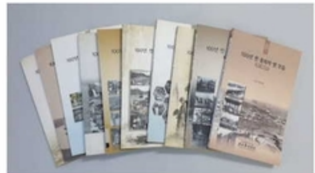
100년 전 충북의 옛 모습 10권

충북역사문화인물 선양사업에서 선정한 충북 지역의 역사문화인물을 주제로 발간한 도서로, 2007년부터 2016년까지 10권을 발간하였다.