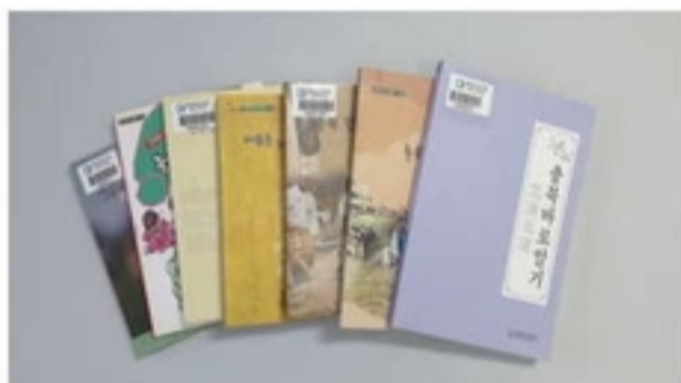
충북학 교양 총서 7권

충북 관련 역사·문화와 관련된 연구자의 연구결과를 정리하여 발간한 총서로 「충북의 석조미술」(2000), 「충북의 민속문화」(2001), 「충북의 고대사회」(2002), 「충북의 선사문화」(2006), 「충북의 구전민요」(2013) 등 7권이 발간되었다.